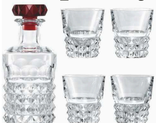
BACCARAT Coffret bar gobelets et carafe Louxor , 2 900 €.

RIZZOLI NEW YORK INTERNATIONAL Livre French Moderne. Cocktails from the 1920s and 1930s , de Franck Audoux, 208 p., 27,95 €.