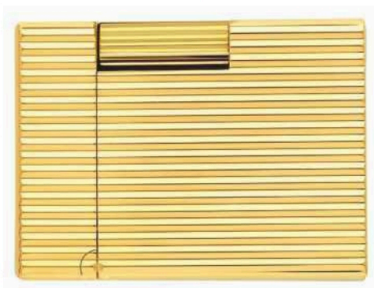
S.T. DUPONT Briquet guilloché doré Ligne 1 , 1 050 €.