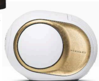
→ DEVIALET Enceinte Phantom Ultimate 98 dB, 1500 €.