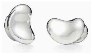
ELSA PERETTI POUR TIFFANY Boutons de manchette Bean design en argent 925 millièmes, 830 €.