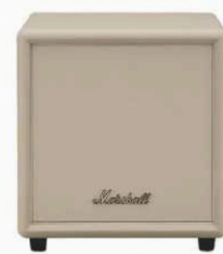
↑ MARSHALL Caisson de basses Heston Sub 200 , 499 €.