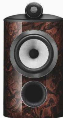
↑ BOWERS & WILKINS Enceinte 805 D4 Signature , 13 500 € la paire.

Quand on aime le son, on le sublime ! Entre transducteurs, traitement acoustique, dispositif antivibratoire et design soigné, les enceintes 2026 promettent un rendu sonore immersif et raffiné, qu'elles se fondent dans le décor ou jouent les protagonistes.