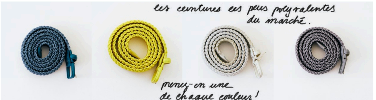
L'AIGLON chez BEIGE HABILLEUR

les ceintures les plus polyvalentes du marché.